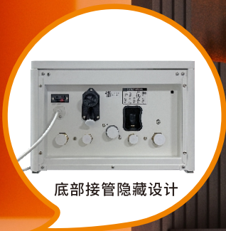
底部接管隐藏设计